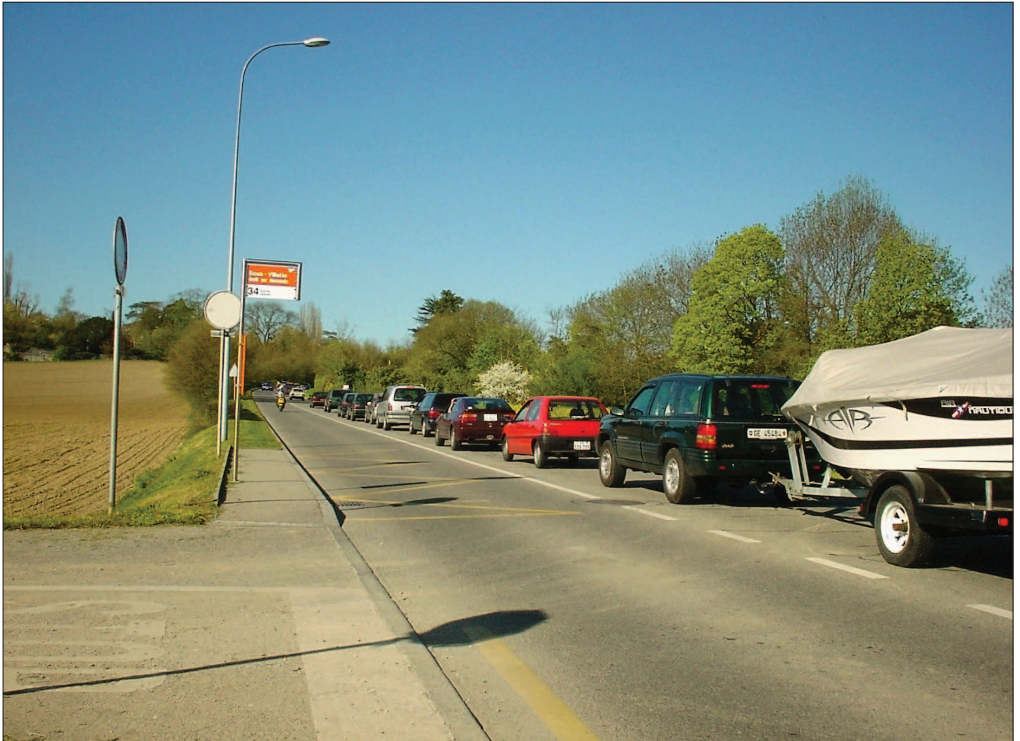
Spectacle quotidien sur l'avenue de Thônex dès 17h.

Les élus boudant le salon de l'auto ou ceux qui décrivent cette dernière, sans oublier leurs cousins, n'avaient, semble-t-il, pas prévu