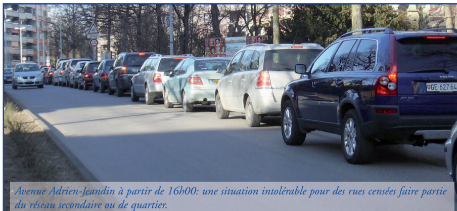
Avenue Adrien-Jeandin à partir de 16h00: une situation intolérable pour des rues censées faire partie du réseau secondaire ou de quartier.

PREMIER CONSTAT: LA COMMUNE DE THÔNEX, TOUT COMME LA PLUPART DES COMMUNES DU SECTEUR DIT "D'ARVE-ET-LAC", est plutôt mal reliée par route au reste de la Suisse. Deuxième constat: plus de 35 000 pendulaires traversent quotidiennement nos routes et nos rues en utilisant leur véhicule privé – qu'il s'agisse de frontaliers se rendant en ville ou ailleurs, ou d'habitants du secteur d'Arve-et-Lac travaillant à la Praille, à Carouge ou encore à Plan-les-Ouates – en empruntant l'axe nord-sud (route de Jussy - avenue de Thônex - Pont de Sierne). Troisième constat: Thônex fait partie des communes du canton de Genève vouées à être densifiées par la construction de nouveaux quartiers dont les Communaux d'Ambilly.